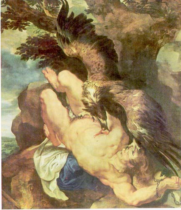
Peter Paul Rubens i Frans Snyders Prometeusz skowany , 1611-1612