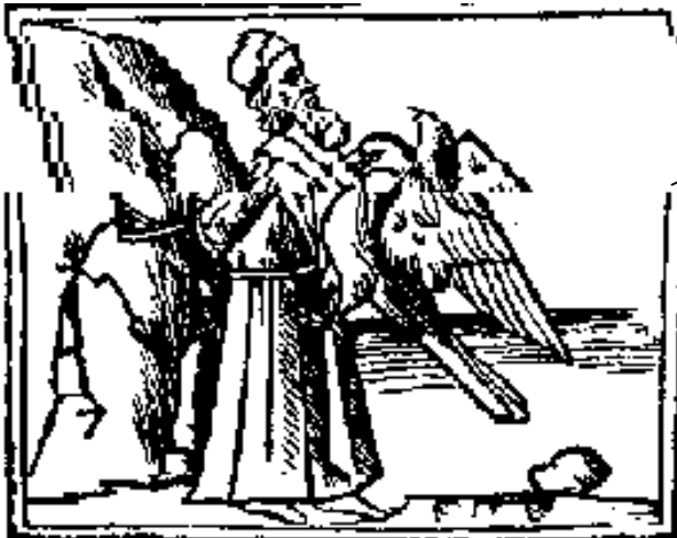
Prometeusz Rycina XVI w.